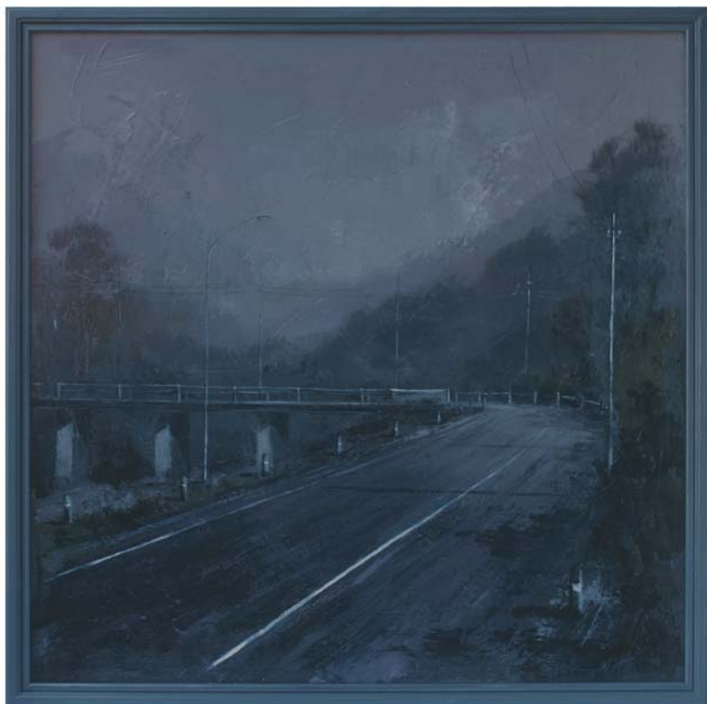
di CLAUDIO POMPEO - Colfosco (TV) "Strada periferica" cm 90x90

"Per aver trasfigurato il rapporto tra uomo e natura con una impostazione tradizionale in chiave contemporanea."