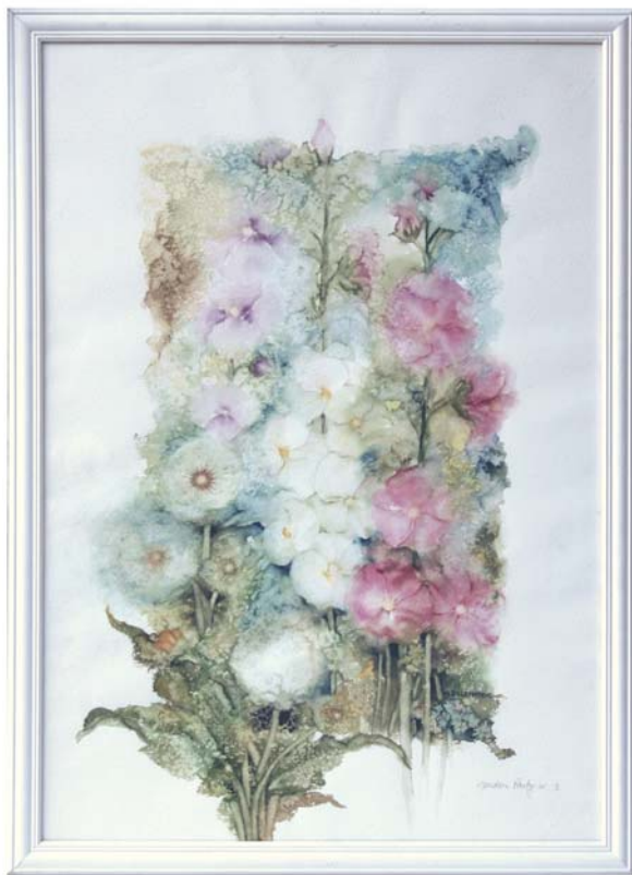
di SANDRA DI LENARDO - Basagliapenta (UD) "Garden party n°1" cm 50x70

"Per l'eccezionale tecnica minuziosa e accurata nella resa dei particolari e della profondità."