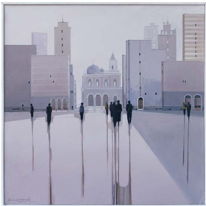
di ELIO CARNEVALI - Pegognaga (MN) "Incontro" cm 70x70

"Una verticalità che va oltre i confini reali della tela, giocata con mezze tinte per accentuare l'atmosfera surreale."