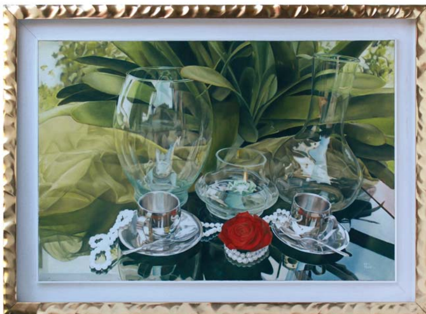
di FLAVIA FORLIN - Cison di Valmarino (TV) "Gioco di riflessi" cm 90x70

"Per l'eccezionale gioco di trasparenze e sovrapposizioni di piani che creano un elegante frammento di raffinata quotidianità."