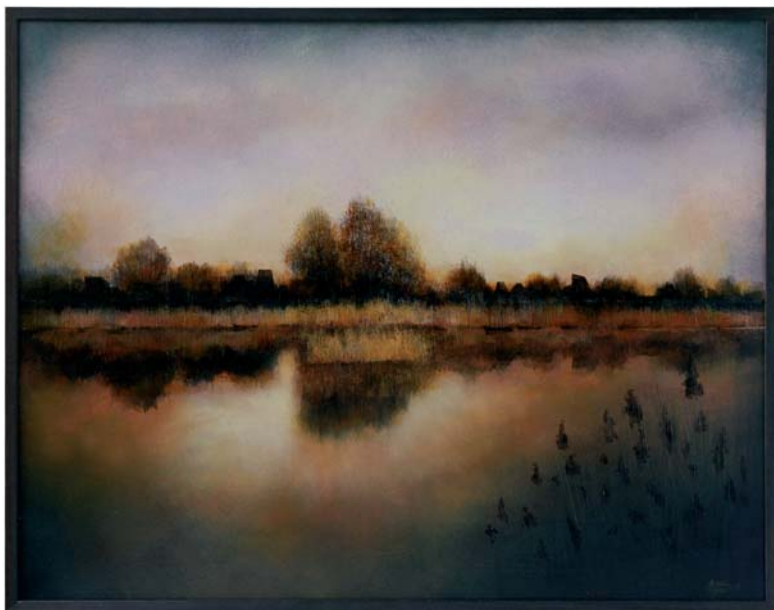
di MARINA MIAN - San Gaetano (Caorle - VE) "Casoni in laguna" cm 90x70

"L'atmosfera sospesa della laguna viene definita attraverso effetti luminescenti coniugati alla cura per il dettaglio."