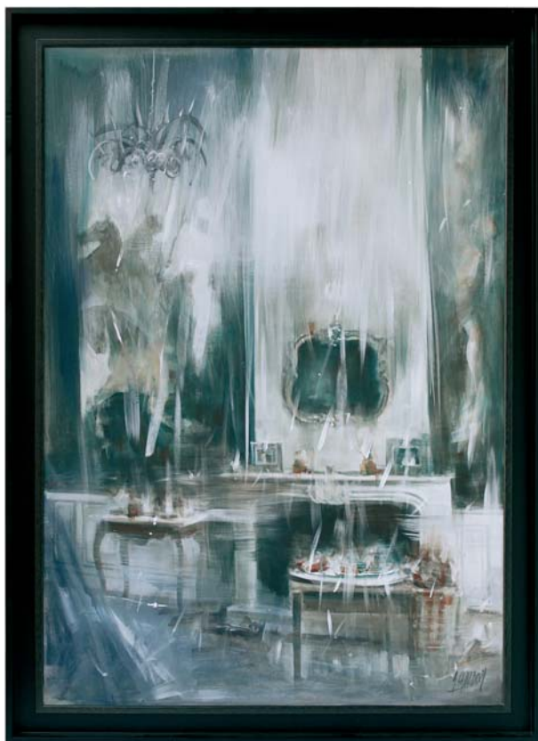
di GIAMPIETRO CAVEDON - Marano Vicentino (VI) "Interno" cm 70x100

"Racconto lirico che diventa visione scatenando un labirinto di emozioni."