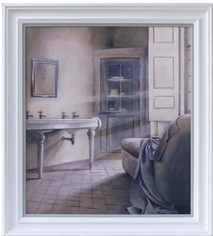
di GIUSEPPE FOCHE SATO - Schio (VI) "Interno giorno" cm 70x80

CORDIGNANO (TV) Via Leopardi, 7 Tel. 0438 779100