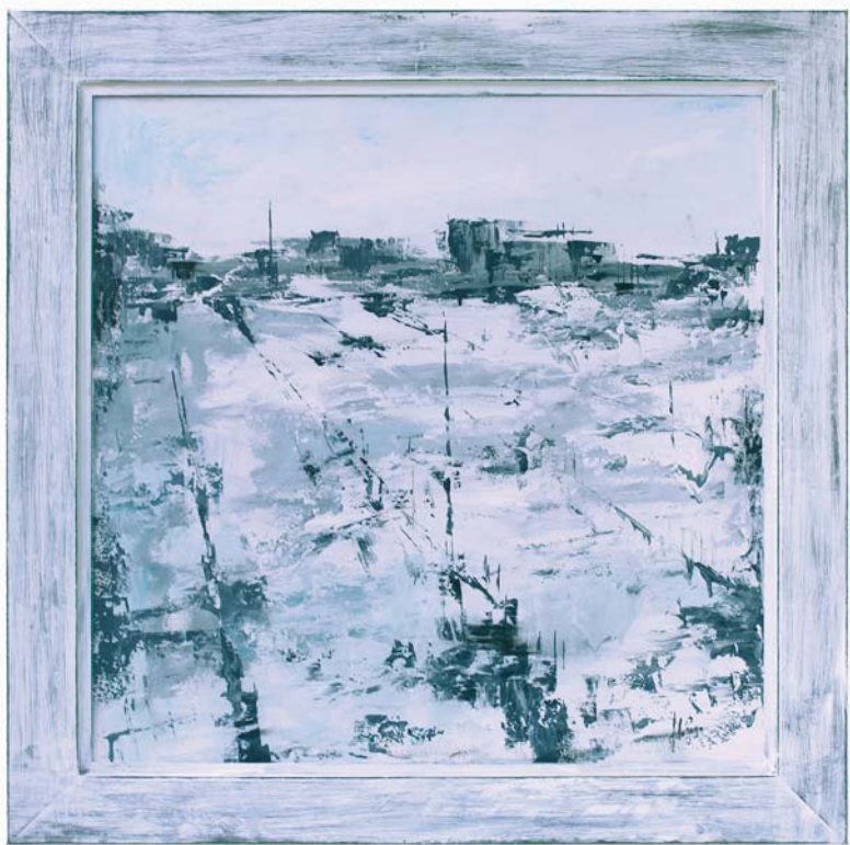
di SILVIO ZAGO - Cavarzere (VE) "Attesa" cm 80x80

"Per aver dato movimento alla staticità con linee e gruppi di colore, giocando quindi con una dualità."