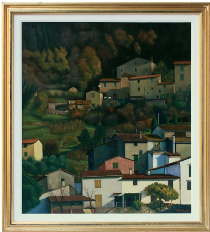
di MARIO ANIELLO - Prato (PO) "Valdibisenzio" cm 65x75

"La costruzione architettonica iperrealistica si fonde per colore e forme al retrostante paesaggio, creando un'unica visione di insieme."