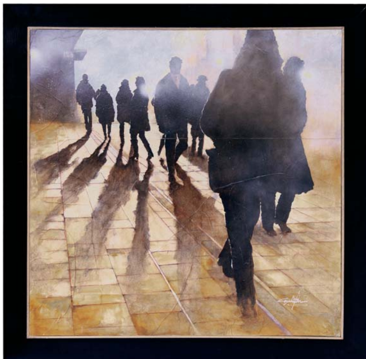
di BRUNO CESELIN - Divignano (NO) "Inizio del nuovo giorno" cm 70x70

"Per il forte taglio prospettico che ci proietta figure e ombre in controluce, dove l'identità è una dimensione."